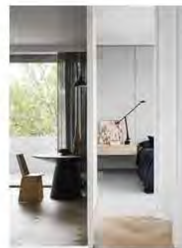
Un BINOMIO perfecto