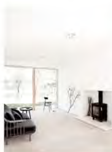
MINIMALISMO en el CAMPO INGLÉS