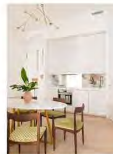
Un viaje al CENTRO de Madrid