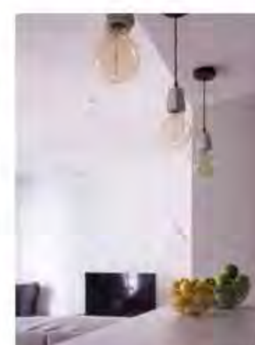
Una REFORMA que cambió los planes