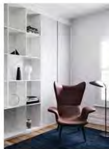
Notas de AZUL en MELBOURNE