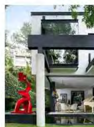
Vivir con (mucho) ARTE