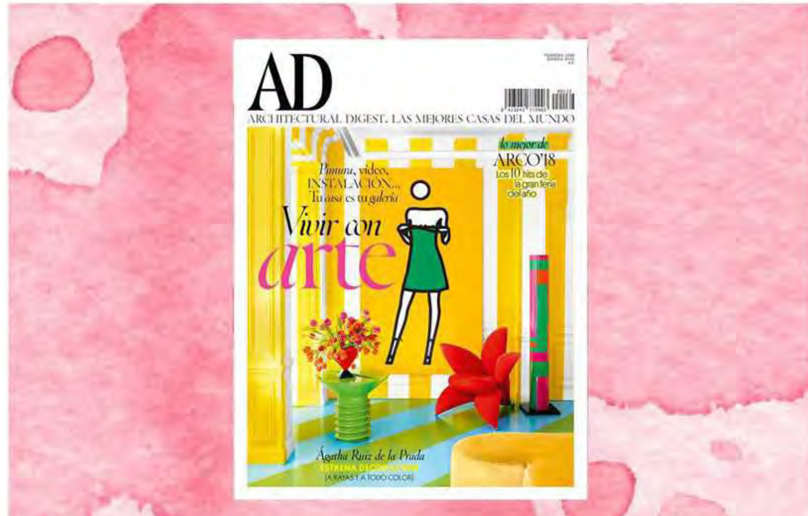
Toma nota, o mejor enmarca, cada una de estas páginas dedicadas a la creatividad, la libertad y la energía y prepara tu propia inauguración. Tu casa es tu galería.