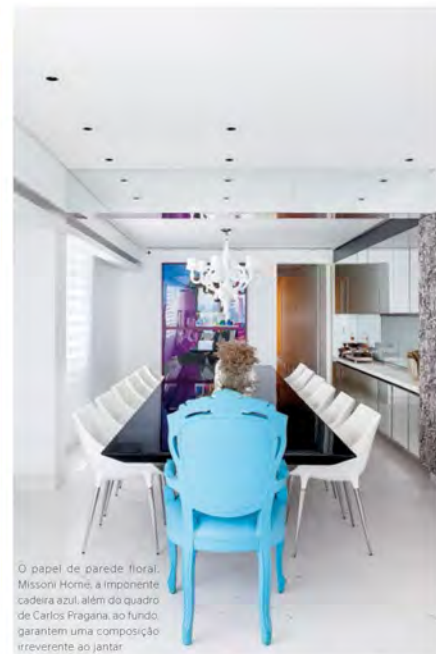
O papel de parede floral, Missoni Home, a imponente cadeira azul, além do quadro de Carlos Prágua, ao fundo, garantem uma composição irreverente ao jantar

No jantar, a aplicação do tecido com estampa floral, Missoni Home, no painel, aliada ao uso de peças marcantes como as cadeiras Passion, Cassina, o lustre Paper Chandelier XL, Moooi, além das obras de arte, garantem uma composição irreverente. A cozinha recebeu base neutra e mobiliário planejado, além de detalhes coloridos nos armários e nicho e prateleira em verde neon.