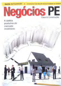
Capa edição 12